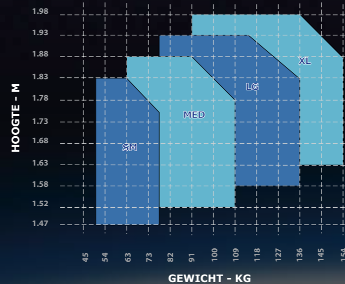
ExoFit NEX™ Full Body Harness Sizing Chart

CE EN361 Valharnas, CE EN361 Gordel voor werkpositionering (niet bij alle modellen),