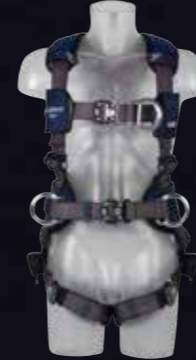
ExoFit NEX™ constructie/klimharnas Tech-Lite™ D-ringen voor- en achterzijde en opzij, Duo-Lok™ snelsluitgespen en ingenaaid heupkussen en lichaams gordel