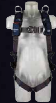
ExoFit NEX™ reddingsharnas Tech-Lite™ D-ringen voor- en achterzijde, 2x schouder Bevestigingspunt voor Reddingsactiviteiten, Duo-Lok™ snelsluitgespen