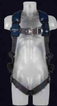
ExoFit NEX™ klimharnas Tech-Lite™ D-ringen voor- en achterzijde, Duo-Lok™ snelsluitgespen