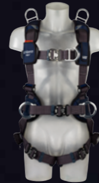
ExoFit NEX™ reddingsharnas met gordel Tech-Lite™ D-ringen voor- en achterzijde, 2x schouder Bevestigingspunt voor Reddings-activiteiten, Duo-Lok™ snelsluitgespen en ingenaaid heupkussen en lichaams gordel